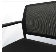
Malla transpirable adjustable armrests

2.- It is possible to adjust the height of the chair at different anthropometric characteristics. Please, contact with us for other available sizes.