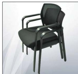
Apilables fácilmente Polished aluminium base