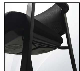
Mecanismo transpiración del bastidor Synchro mechanism