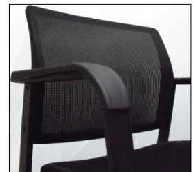
Reposabrazos fijos Fixed armrests